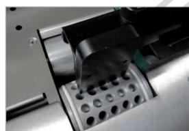
Dispositif de prise papier à succion par le bas