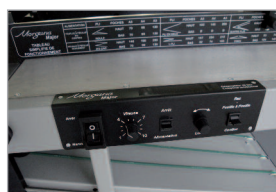
Panneau de commande