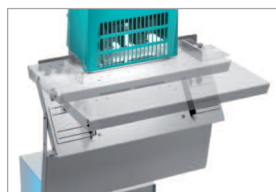
Table pivotante pour agrafage à plat et à cheval

Conforme aux normes de sécurité européennes.