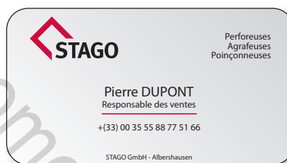
Exemple de coupe arrondie