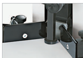
Butées de profondeur et latérales réglables en continu

Conforme aux normes de sécurité européennes.