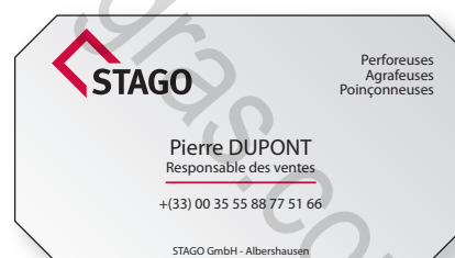
Exemple de coupe losange