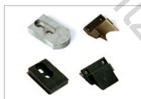
Outils de coupe arrondie et losange avec matrices